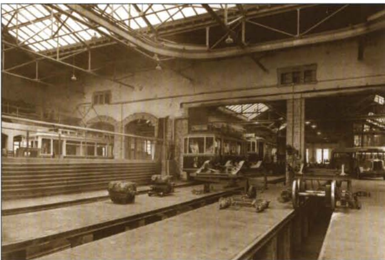
Les ateliers du Tramsschapp en 1951

C'est sur ce programme que l'architecte Romain Hoffmann qui était entré en lice dès le premier avant-projet, élabore son projet définitif qui est présenté pour approbation au conseil communal le 13 décembre 1999.