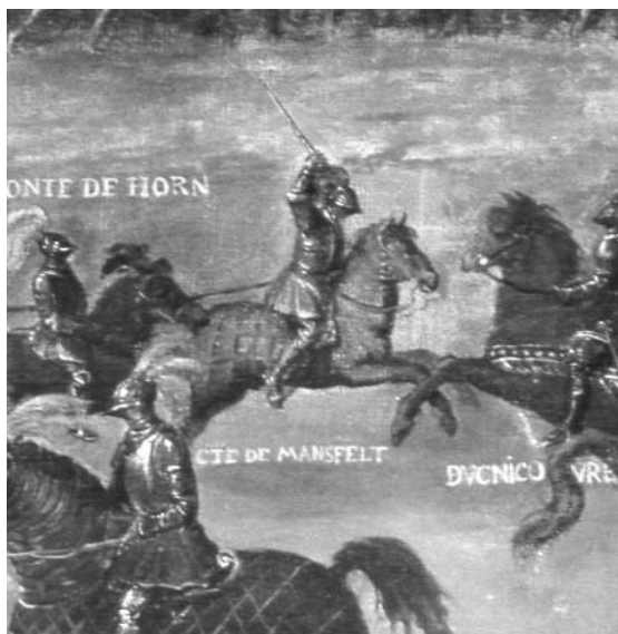
Détail d'un tableau de Jan Cornelis Vermeijen, Le tournoi à Tervuren donné en l'honneur de Philippe, Prince d'Espagne (1 er avril 1549)

à Luxembourg, le château « La Fontaine » et la donation au roi d'Espagne. Un grand nombre d'objets ayant trait à Mansfeld sont déjà connus mais jamais jusqu'ici ils n'ont été rassemblés en un seul lieu et étudiés dans une même perspective exclusivement axée sur lui. Comme toute grande première, notre entreprise a apporté un