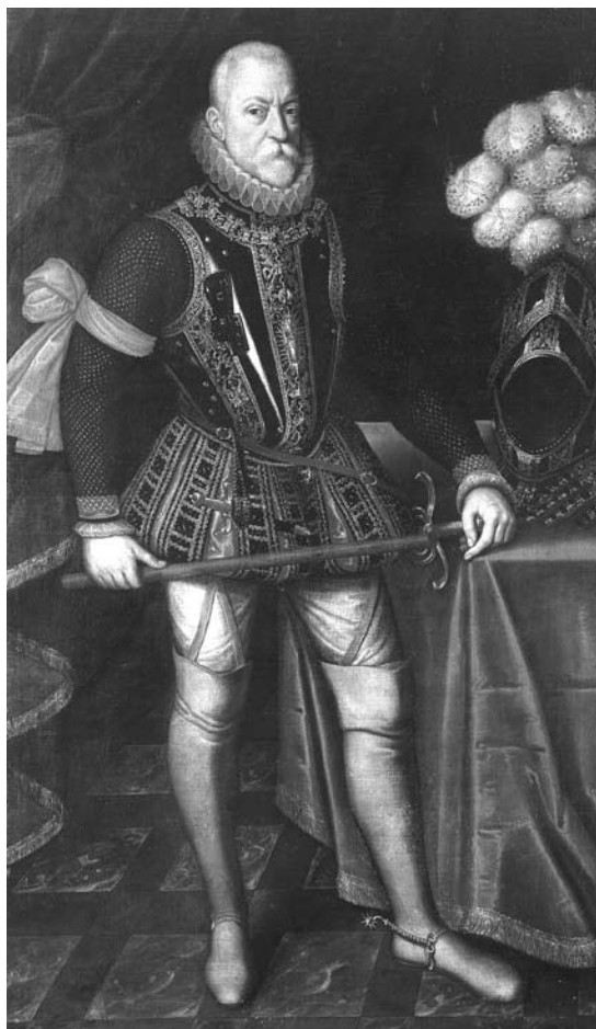
Portrait de Pierre-Ernest de Mansfeld